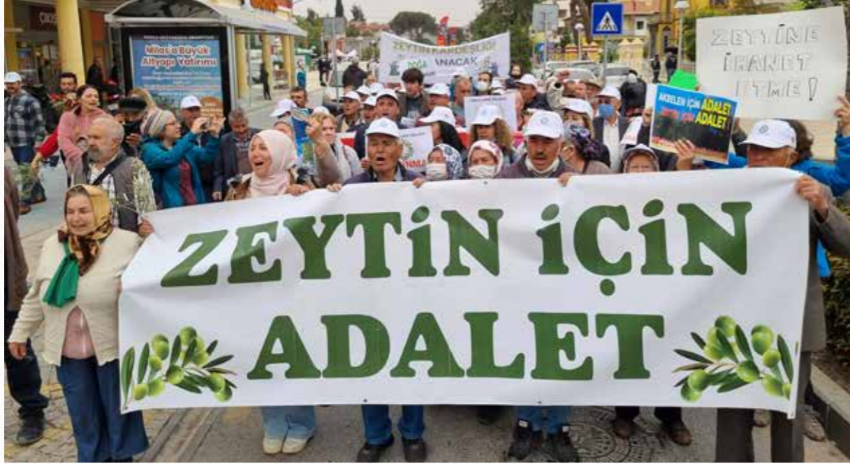
İkizköylüler çeşitli eylemler düzenleyerek seslerini duyurmaya çalışıyor. / Foto: Nisan 2022 Zeytin Hayattır Mitingi

olarak adil geçiş programlarında hükümetler/politika uygulayıcıları, işverenler ve sendikalardan oluşan üç ayaklı sosyal diyalog mekanizması yaygın biçimde kullanılan mekanizmalardan. Milas'ta sendikalar, çevre hareketi temsilcileri, kooperatifler gibi yöredeki işçilerin ve çiftçilerin temsil eden ya da onların haklarının savunuculuğunu yapan oluşumlarla beraber doğrudan yöre halkının karar alıcılar ve işverenlerle buluşturacak kapsamlı bir sosyal diyalog mekanizmasının kurgulanmasına ihtiyaç bulunuyor.