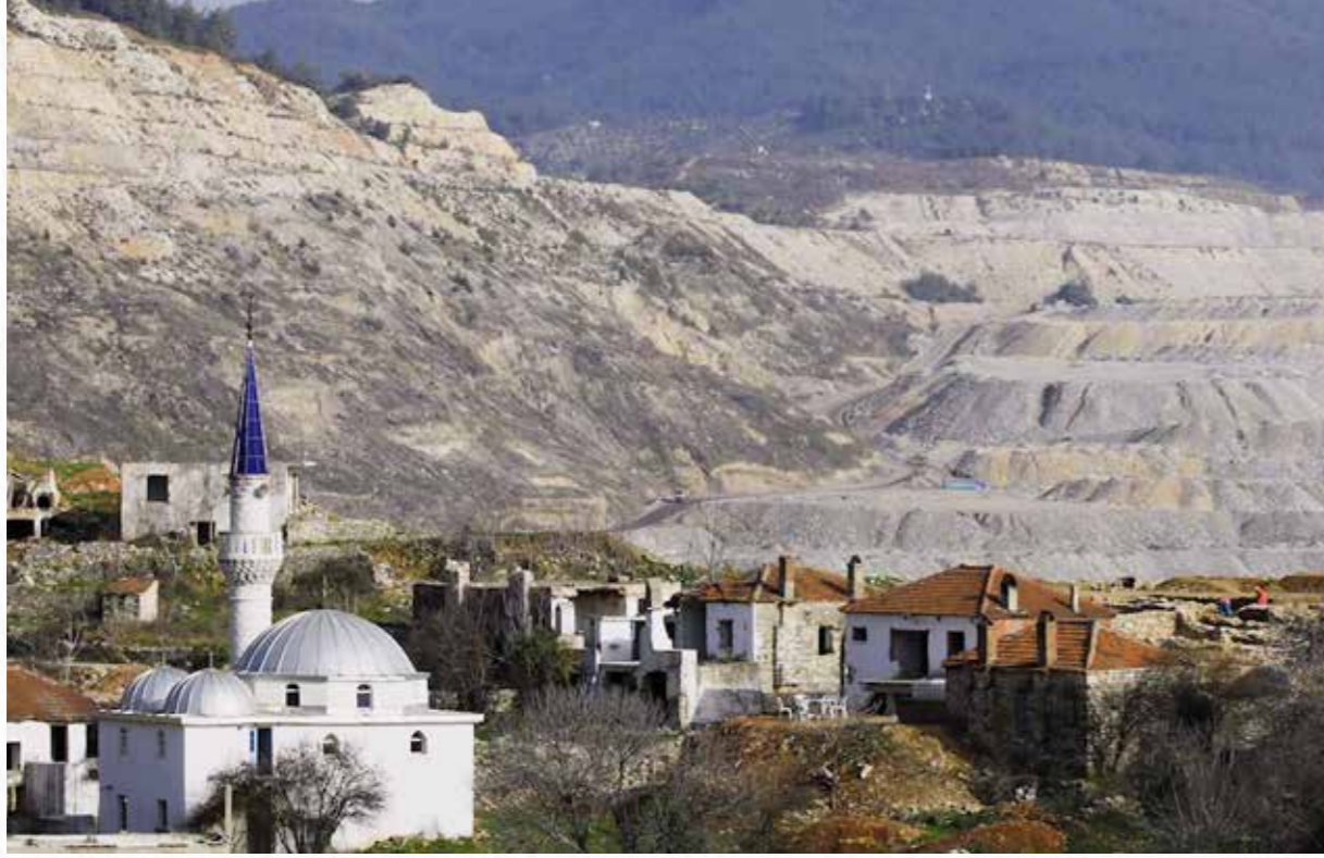
Selen Çatalyürekli, 2021, Muğla

nin sürekli genişlemesi bir yandan ciddi bir ekosistem tahribatına yol açıyor, diğer yandan hak ihlallerini beraberinde getiriyor. Hava kirliliği, su kirliliği, yerinden edilmeler, orman alanlarında tahribat ile Milaslıların termik santraller ve kömür madenlerinin yaşam alanlarına olumsuz etkilerine dair tanıklıkları gösteriyor ki Milas'ta kömürün terk edilmesi şart. Bunlara ek olarak; Türkiye'nin 2053 yılı net sıfır emisyon vizyonu da 2030 yılına kadar Türkiye'nin elektrik üretiminde kömürün sıfırlanmasını gerektiriyor. Yapılan bilimsel çalışmalar, 2030 yılına kadar elektrik üretiminde kömür enerjisinden çıkış hedefinin Türkiye için gerçekçi uygulanabilir bir hedef olduğunu gösteriyor.