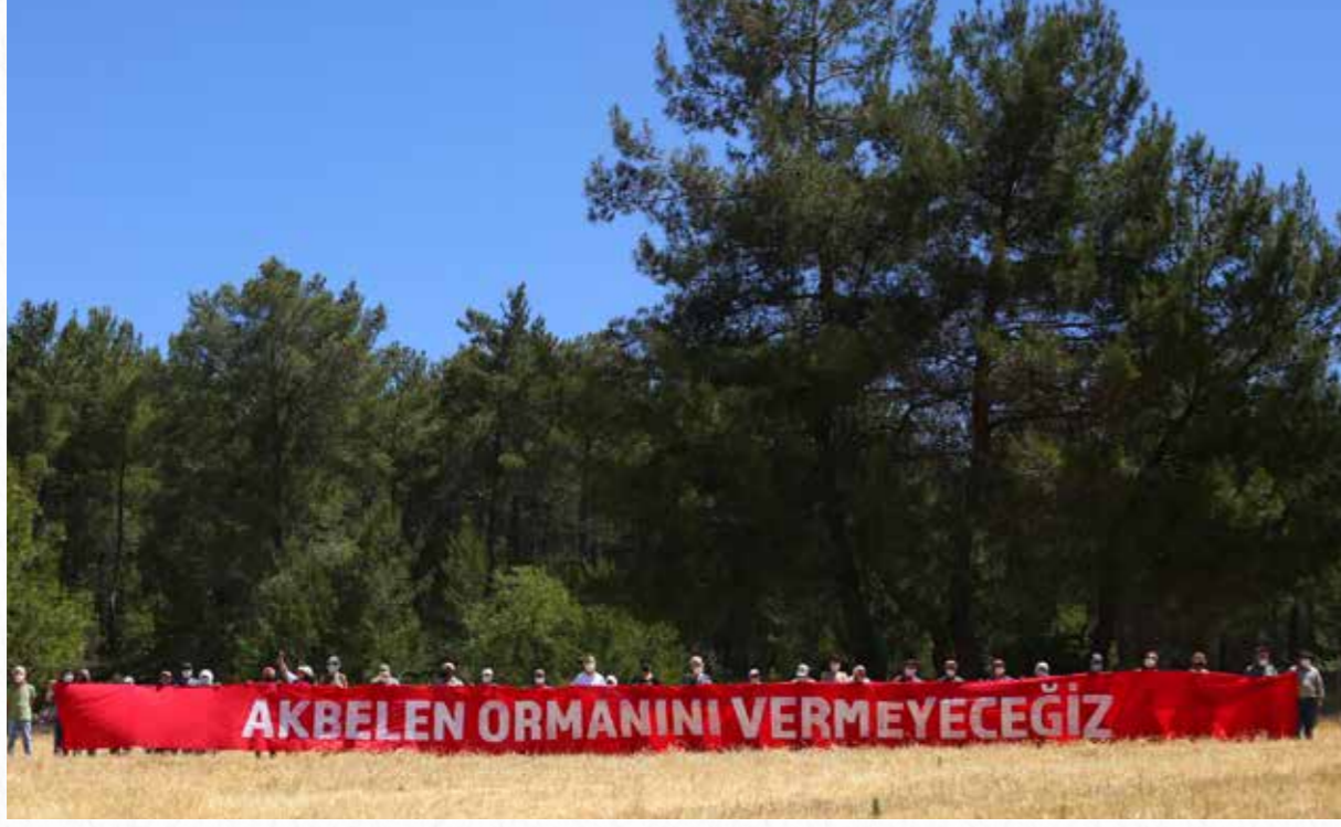
İkizköylüler, Akbelen Orman'ını tehdit eden kömür madenlerine karşı mücadele ediyorlar.

olmak üzere yarattığı tahribat yörede kamu sağlığını birçok yönden tehlikeye atıyor. Hava kirliliği kaynağı olan partikül maddeler akciğer ve kalp rahatsızlıkları, felç, çocukların sağlıksız gelişimi, alzheimer, obezite gibi bir dizi ciddi rahatsızlığın oluşumunda ve gelişmesinde etkili oluyor. Termik santrallerin havaya saldığı kükürt dioksit (SO 2 ) hayati tehlike arz eden akciğer rahatsızlıklarına ve astım gibi kronik rahatsızlığa neden oluyor. Termik santrallerin atmosfere bıraktığı toksik gazlardan biri olan azot oksitler (NO x ) da solunum yollarında yangı (enflemasyon), normal hücre mekanizmalarının bozulması, dokularda hasar ve sonucunda bağışıklık mekanizmasının zayıflaması gibi ciddi sağlık risklerine yol açıyor.