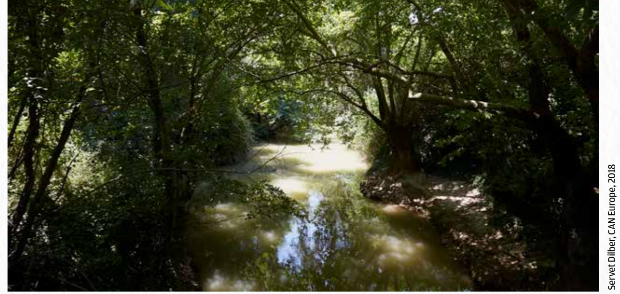
Servet Dilber, CAN Europe, 2018

tarihi eser ve antik kent sayesinde tarih turizmi,